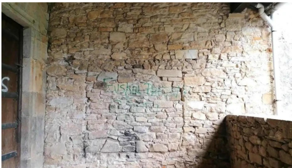
Iglesia san pedro de lumo biscay