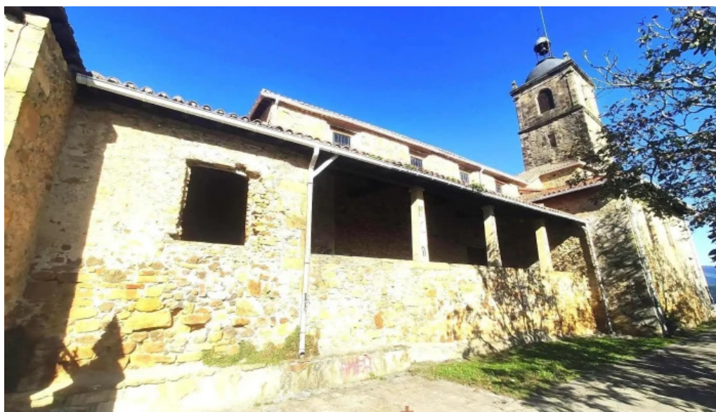
Iglesia san pedro de lumo iglesia