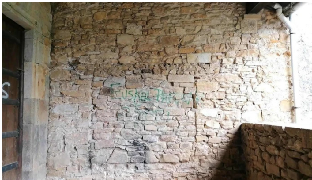
Iglesia san pedro de lumo iglesia catolica