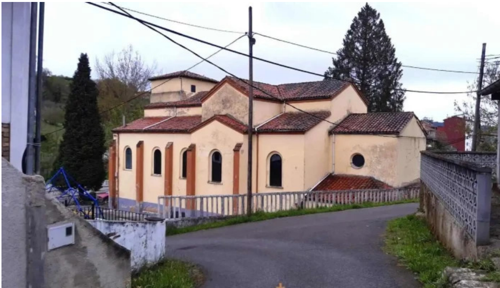
Iglesia de san antonio de lada iglesia catolica