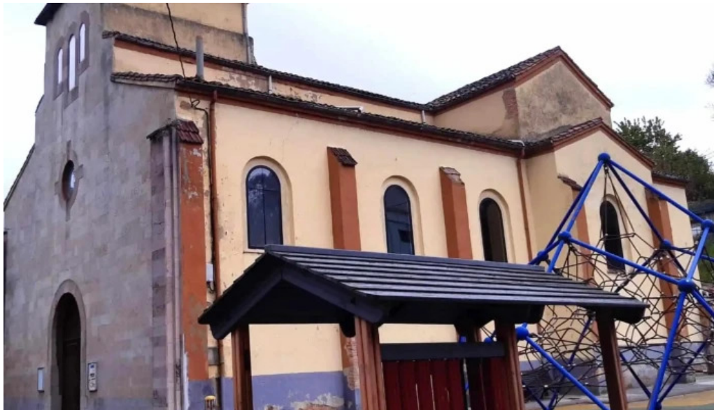
Iglesia de san antonio de lada langreo