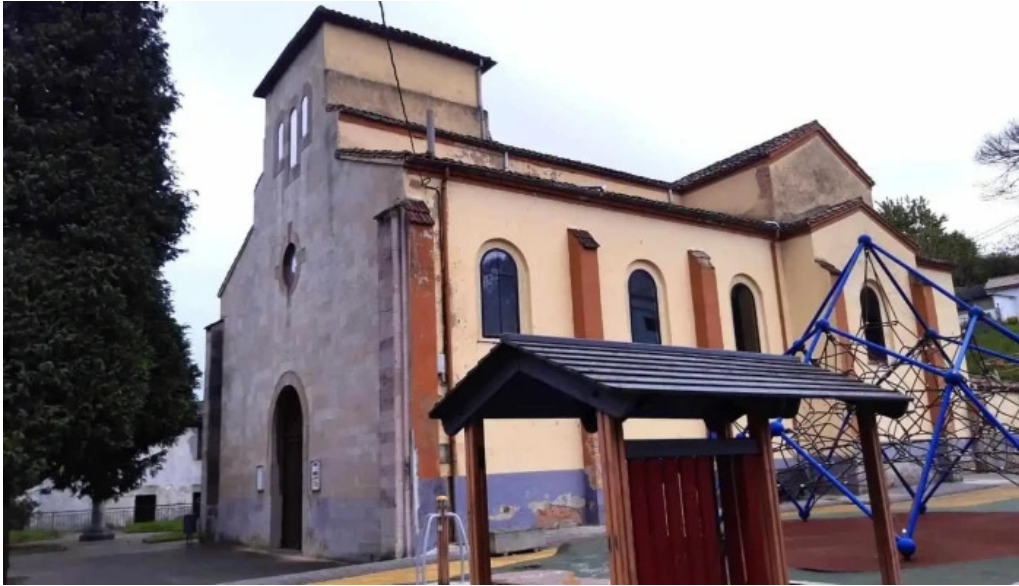
Iglesia de san antonio de lada iglesia