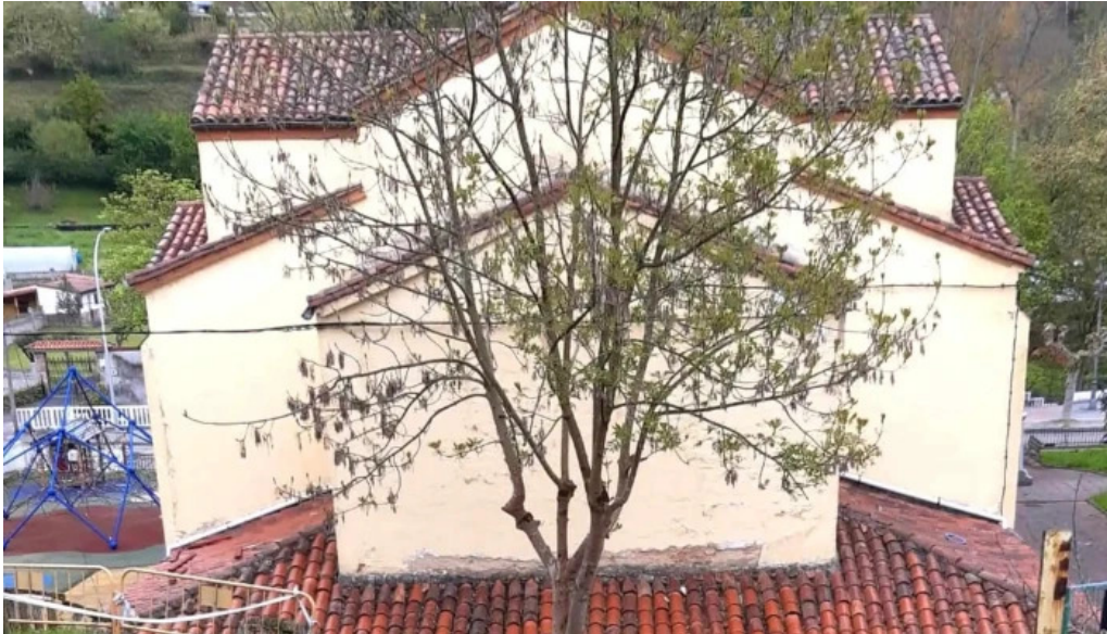
Iglesia de san antonio de lada descuentos