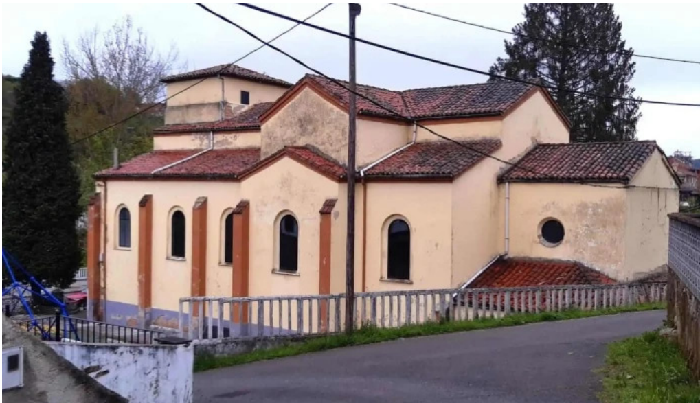
Iglesia de san antonio de lada cerca de mi