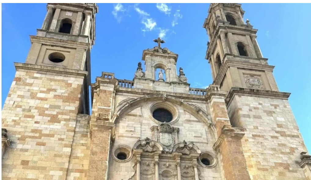
Iglesia de san juan y san pedro de renueva videos