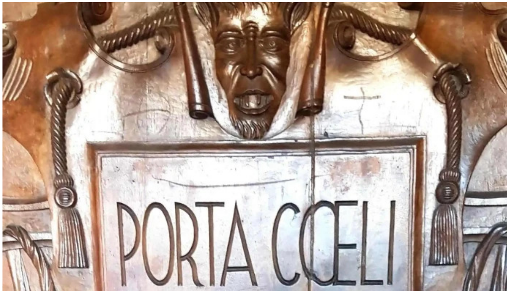
Iglesia de san juan y san pedro de renueva ubicacion