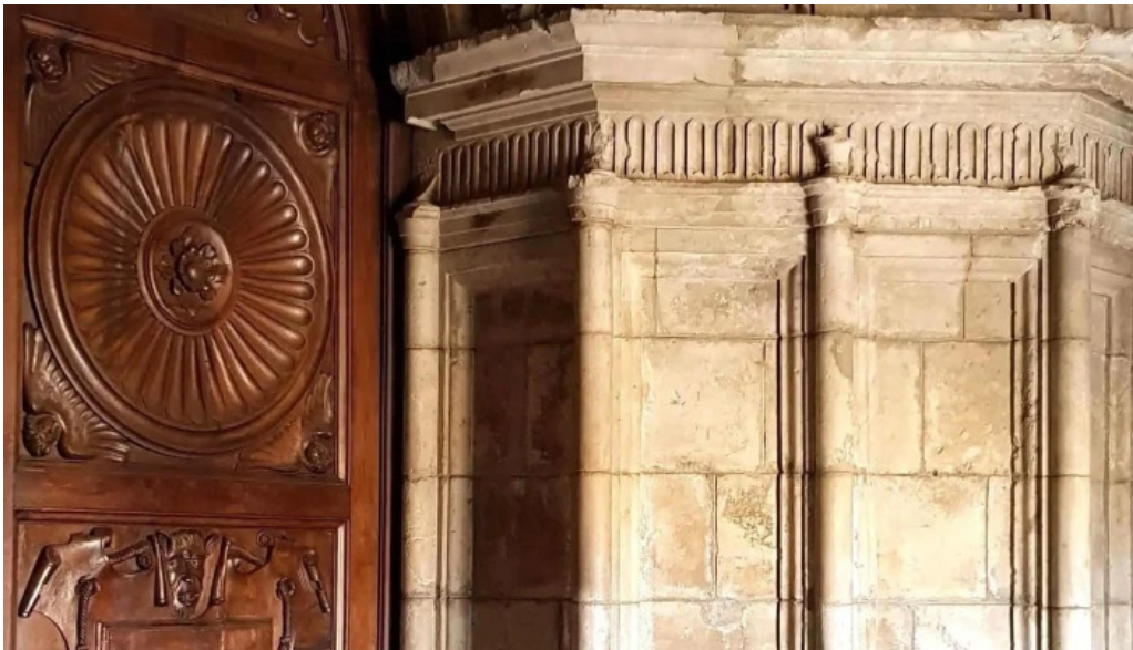
Iglesia de san juan y san pedro de renueva donde