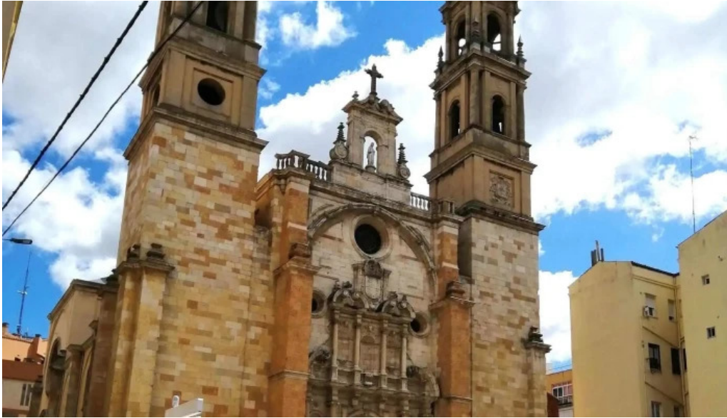
Iglesia de san juan y san pedro de renueva leon