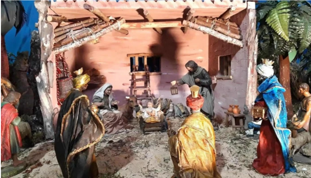
Iglesia de san juan y san pedro de renueva precios