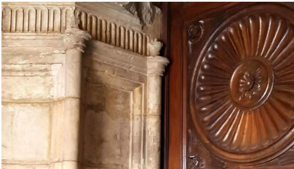
Iglesia de san juan y san pedro de renueva telefono