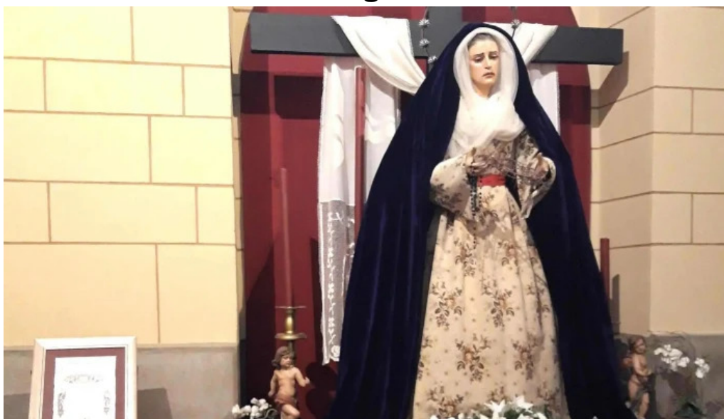
Iglesia de san juan y san pedro de renueva zona