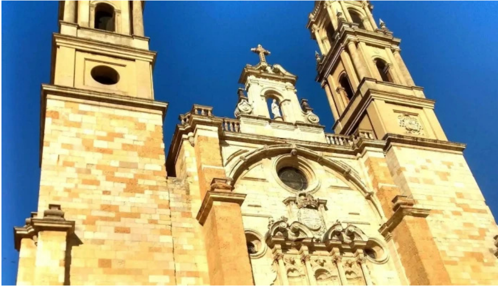
Iglesia de san juan y san pedro de renueva sitio web