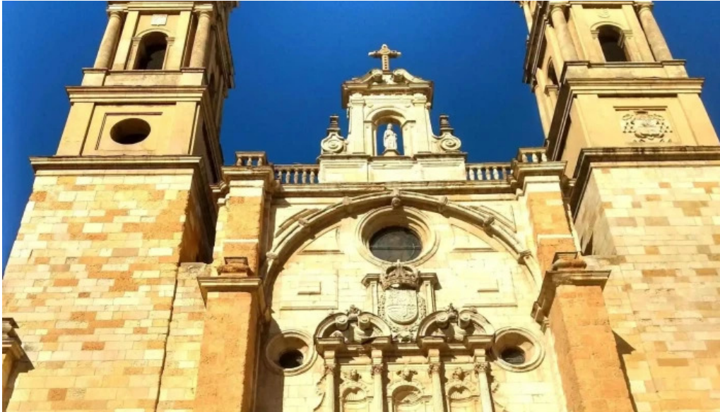
Iglesia de san juan y san pedro de renueva cerca de mi