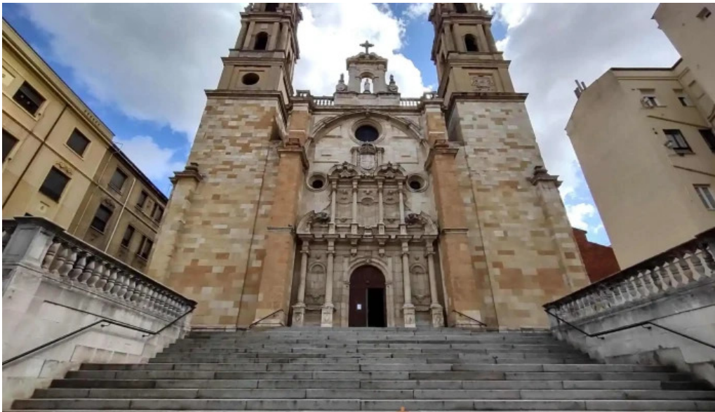
Iglesia de san juan y san pedro de renueva iglesia