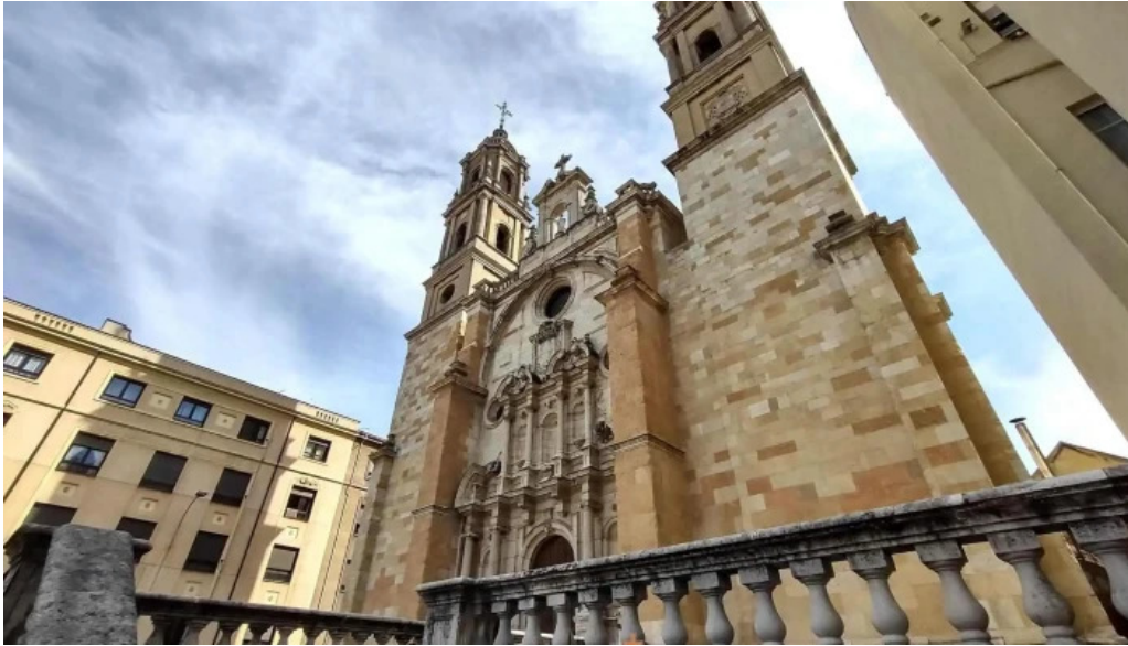
Iglesia de san juan y san pedro de renueva iglesia catolica