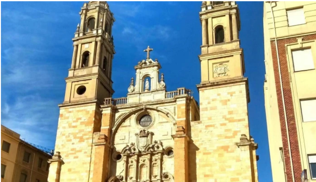
Iglesia de san juan y san pedro de renueva puntaje