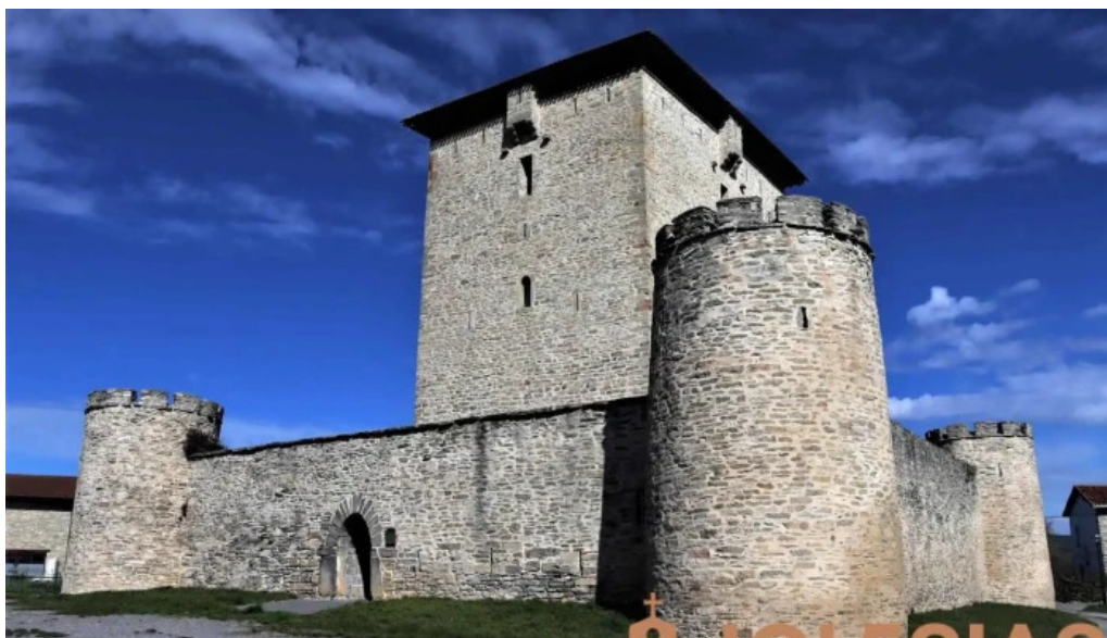
Iglesia de san esteban iglesia catolica