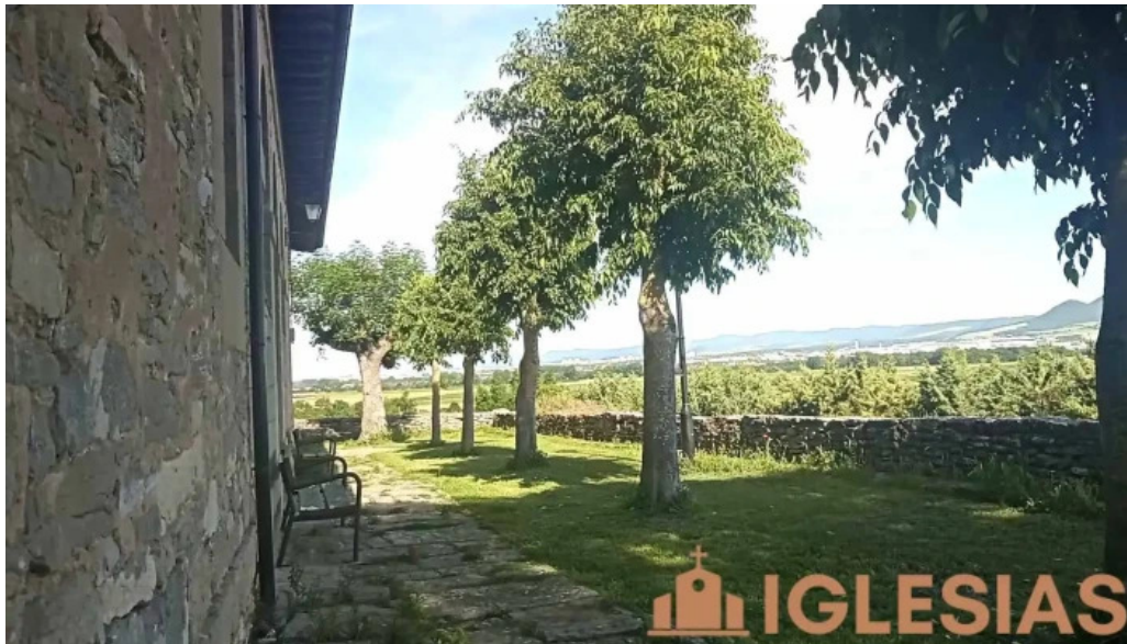
Iglesia de san esteban videos