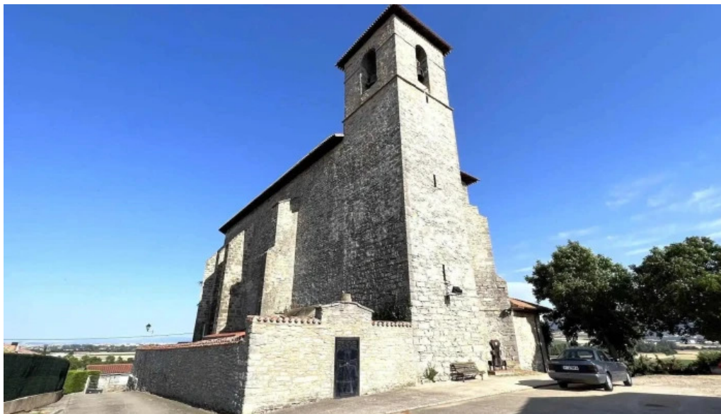
Iglesia de san esteban iglesia