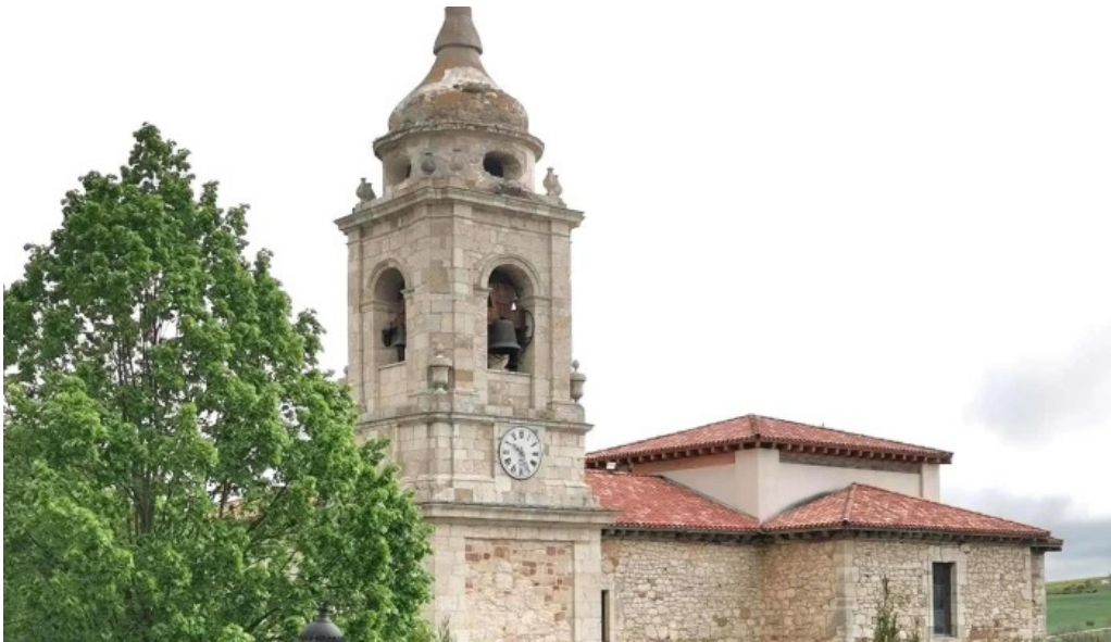
Iglesia de santiago apostol catalogo