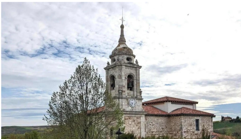
Iglesia de santiago apostol abierto ahora