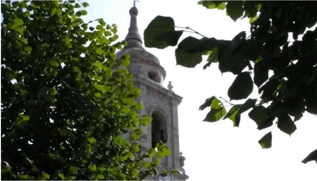
Iglesia de santiago apostol comentarios