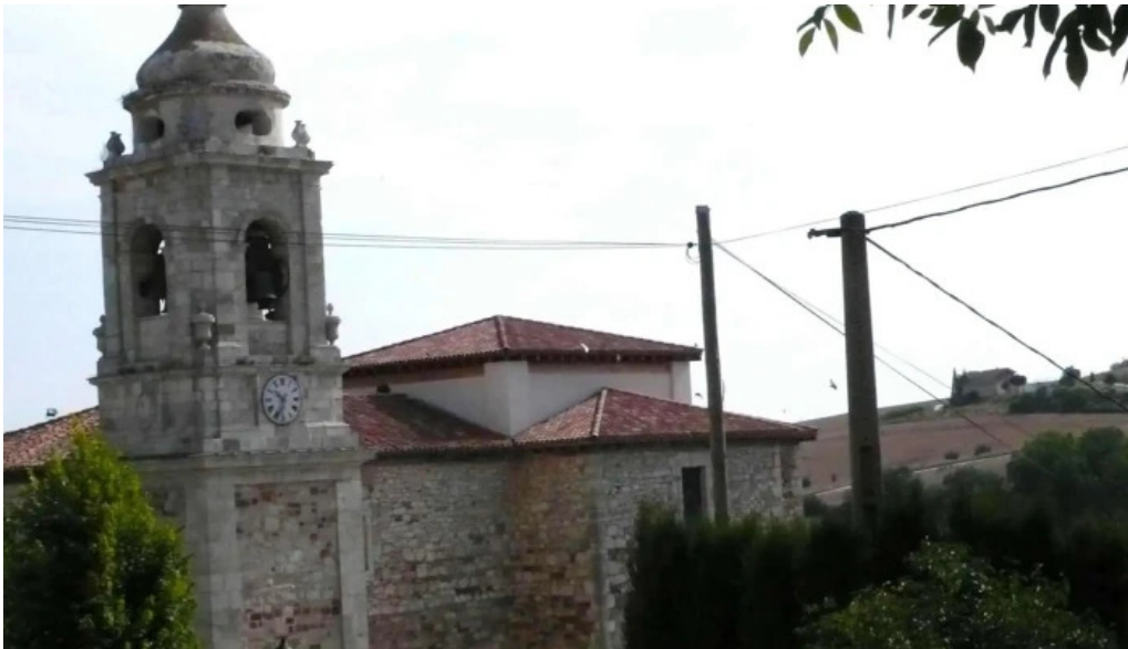
Iglesia de santiago apostol instagram