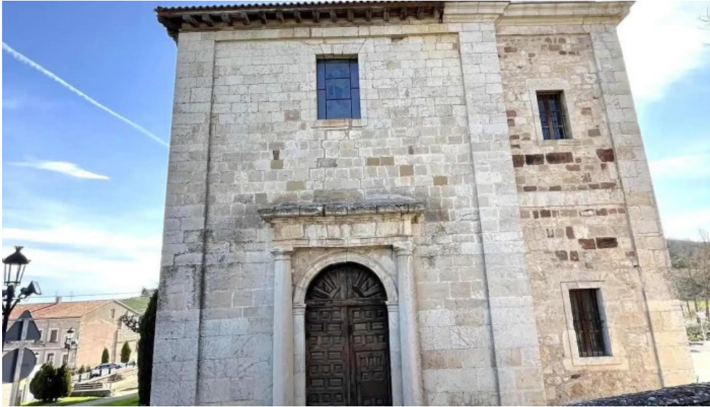
Iglesia de santiago apostol iglesia catolica