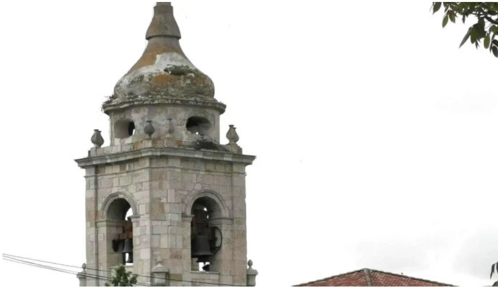
Iglesia de santiago apostol promocion