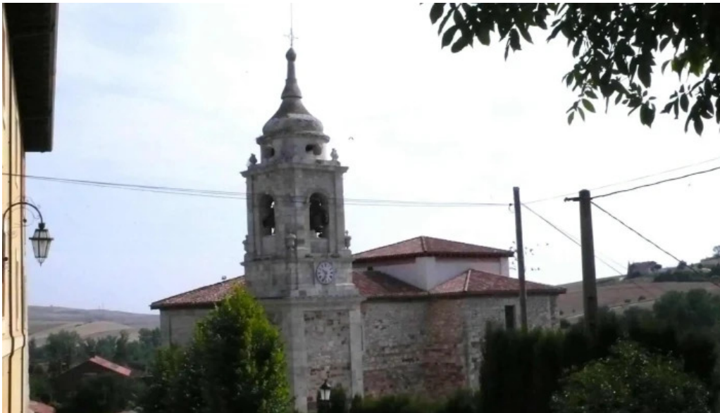
Iglesia de santiago apostol horario