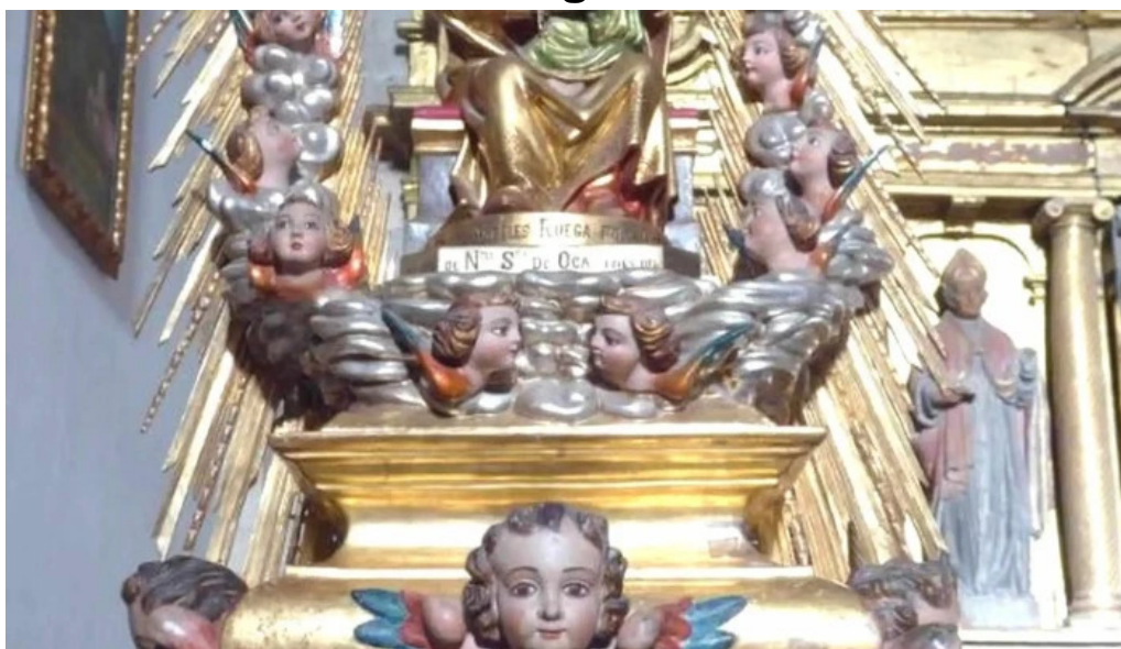
Iglesia de santiago apostol zona