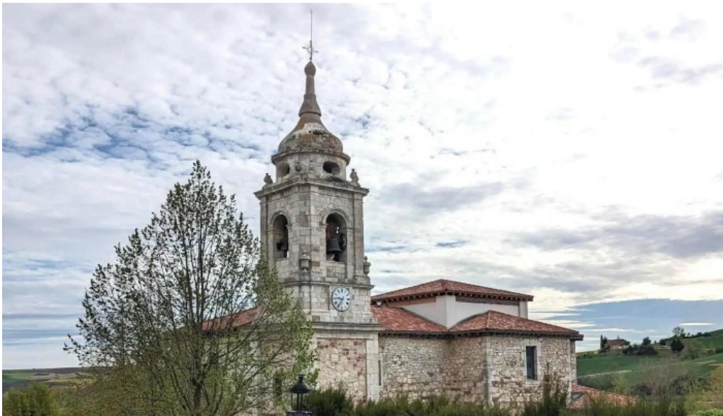
Iglesia de santiago apostol descuentos