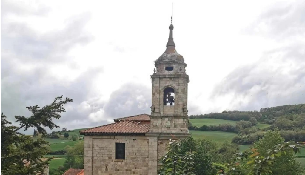
Iglesia de santiago apostol fotos