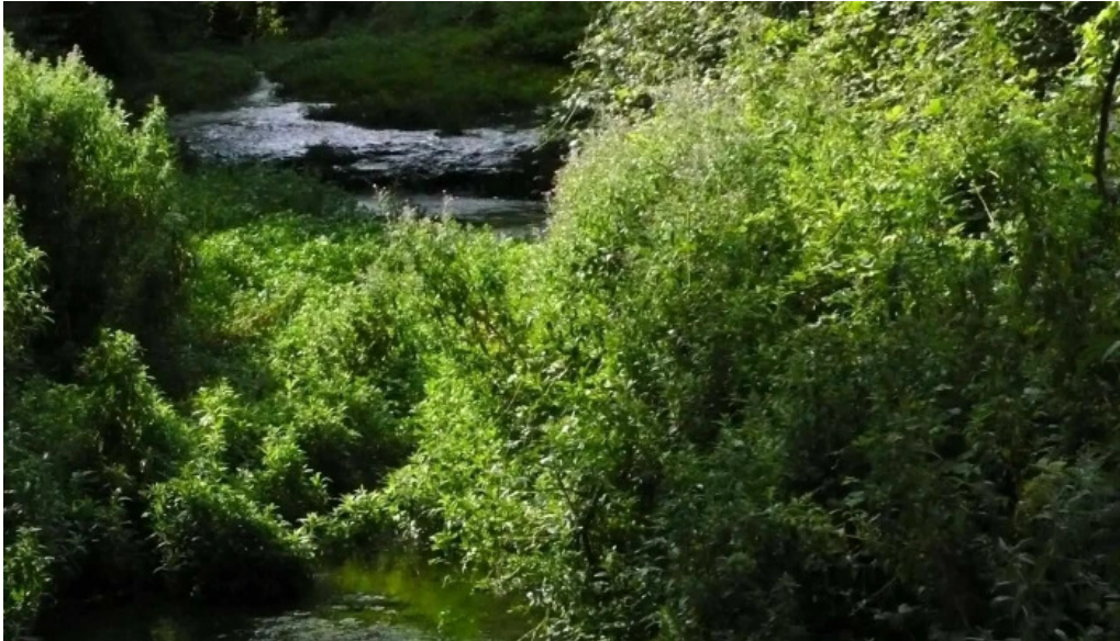
Iglesia de santiago apostol villafranca montes de oca