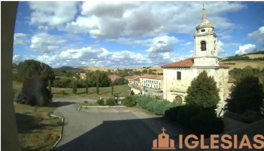
Iglesia de santiago apostol iglesia