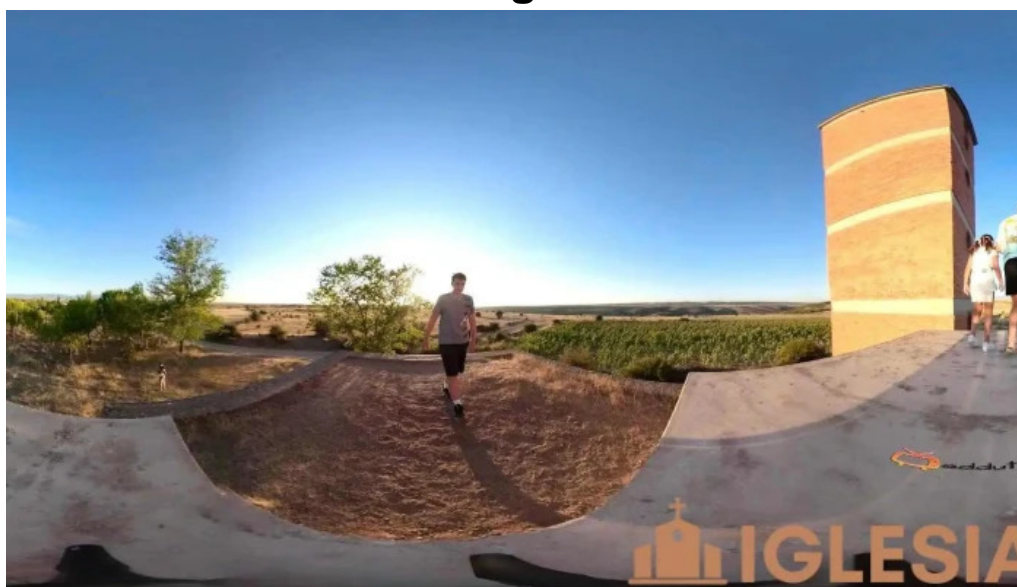
Iglesia de nuestra senora del rosario villar de sobrepena