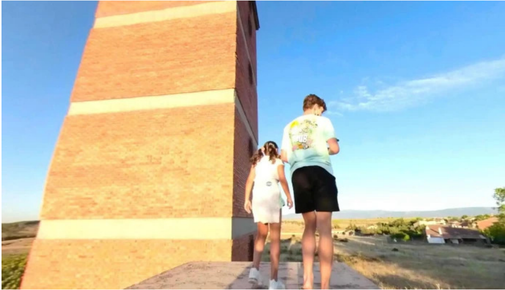
Iglesia de nuestra senora del rosario iglesia catolica