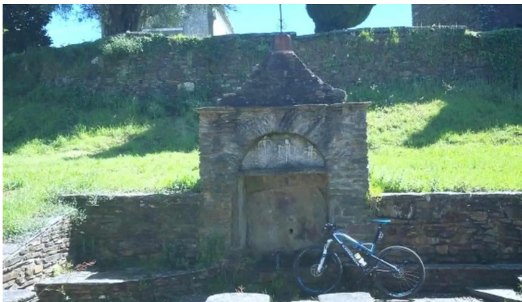
Iglesia de san juan de fontes rosas a coruna