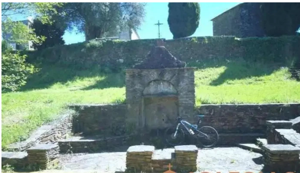
Iglesia de san juan de fontes rosas iglesia