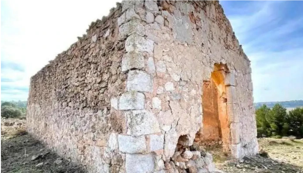
Ermita de el molar abengibre