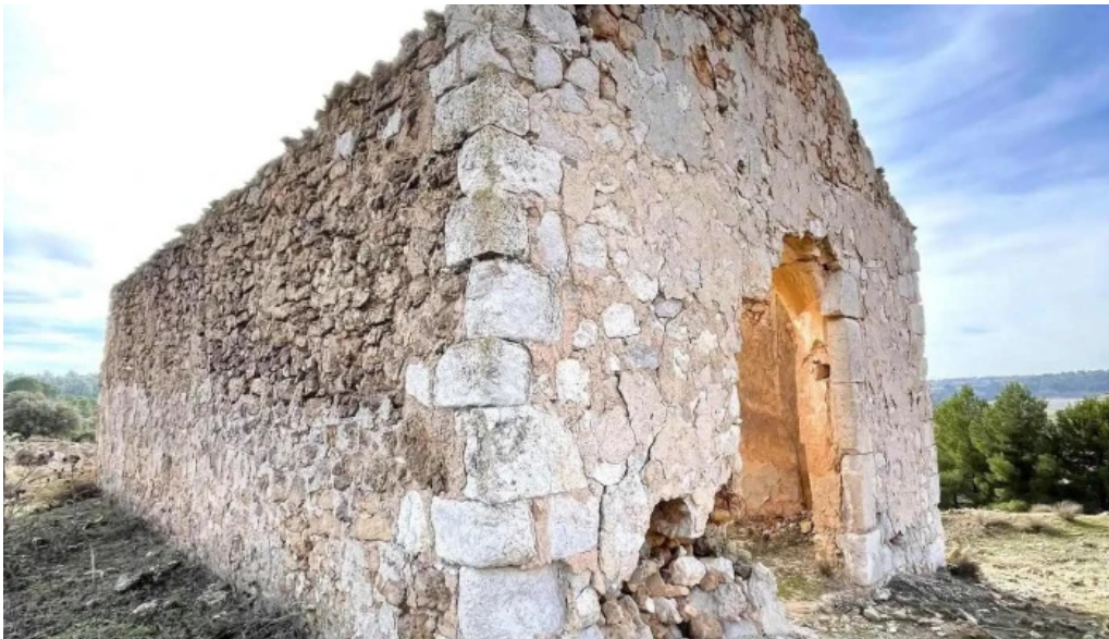
Ermita de el molar iglesia