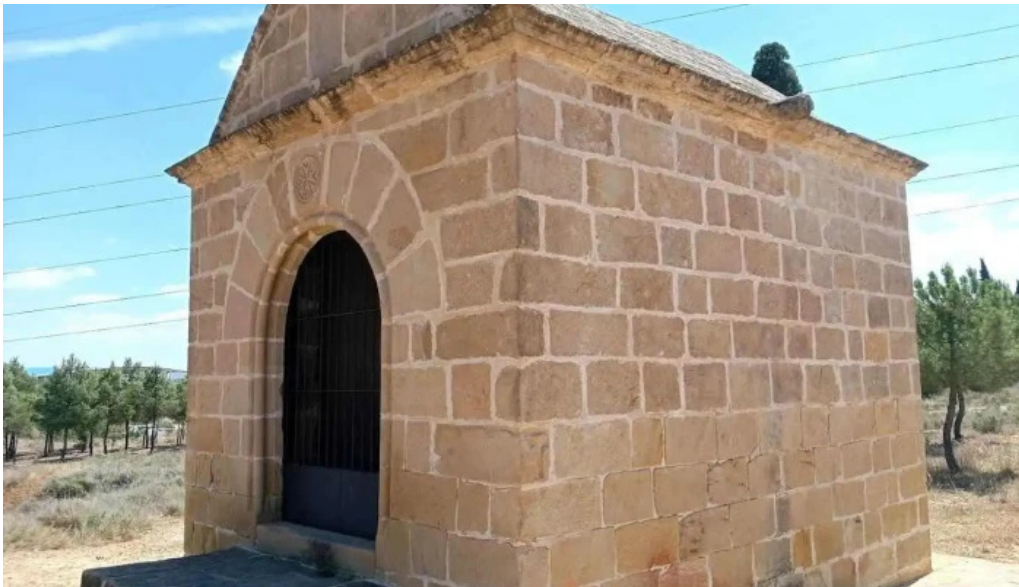
Ermita del santo sepulcro caspe