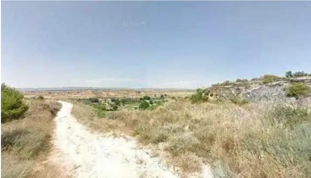
Ermita del santo sepulcro horario