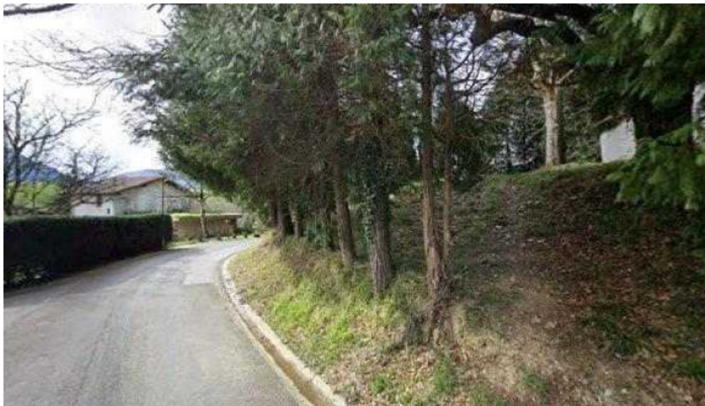
Ermita de san mames zona