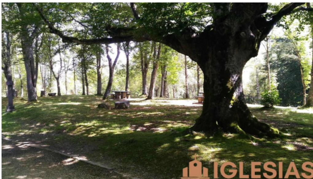
Ermita de san mames iurreta