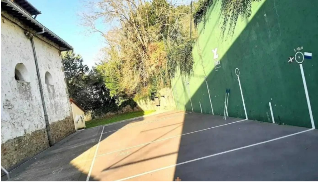
Iglesia otxaran mimetiz