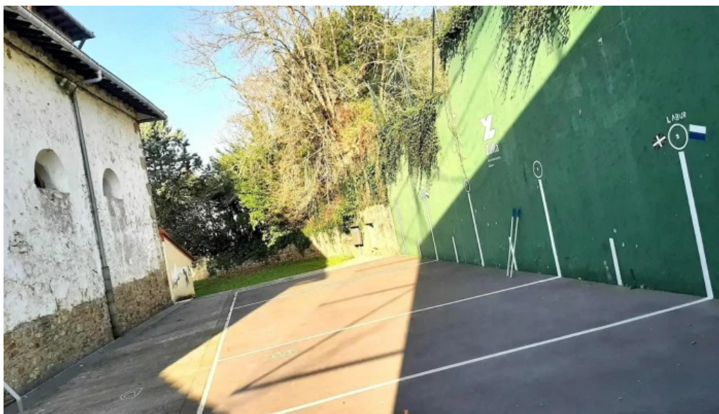
Iglesia otxaran iglesia