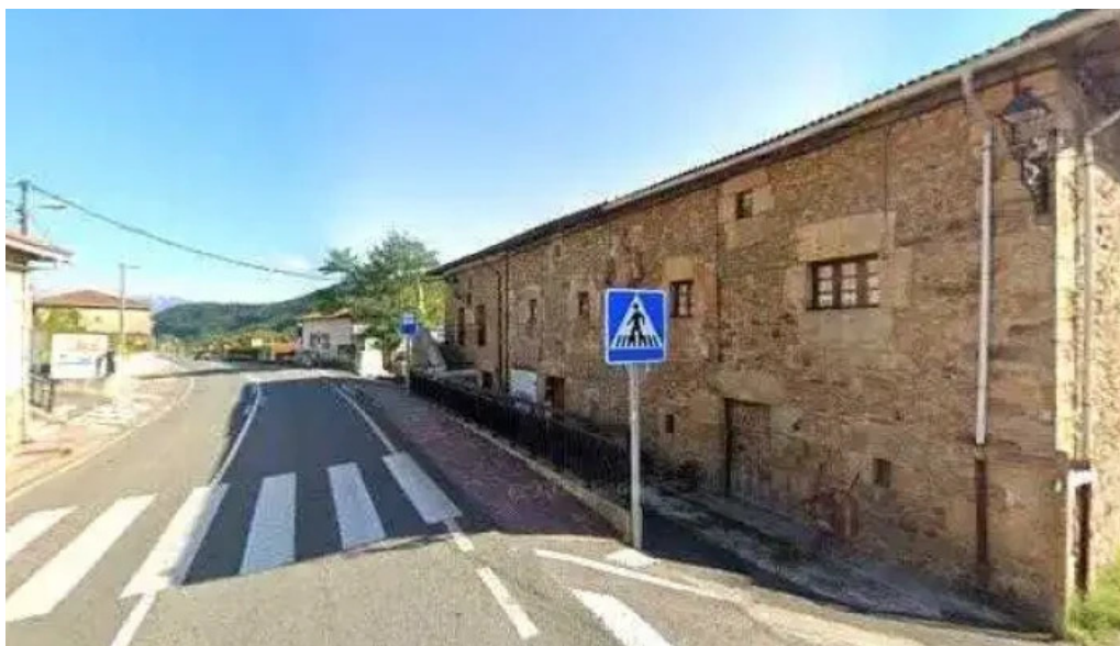
Iglesia otxaran catalogo