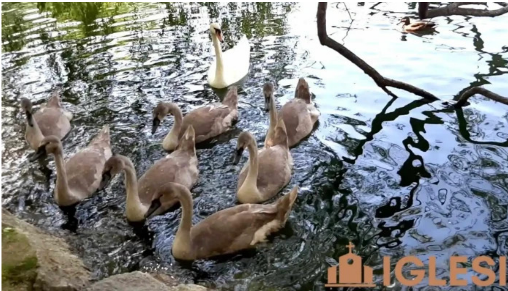
Fontanals de cerdana videos