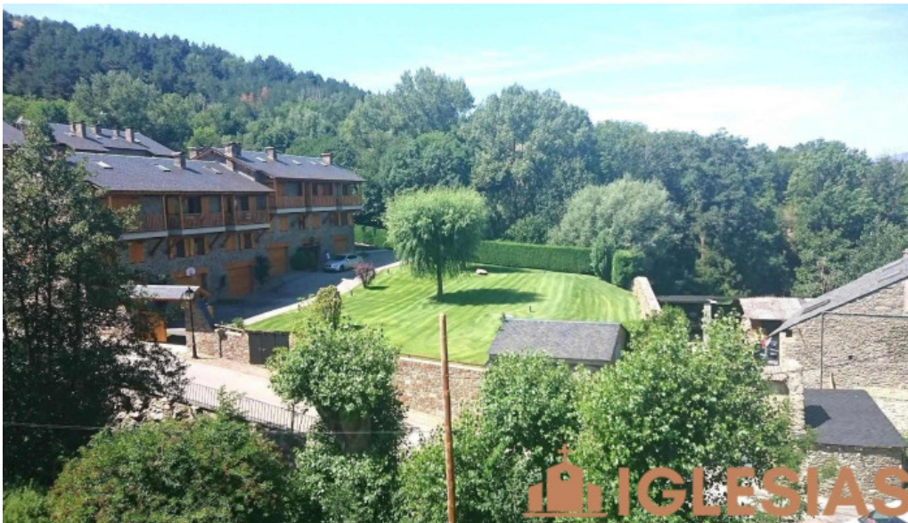
Fontanals de cerdana girona