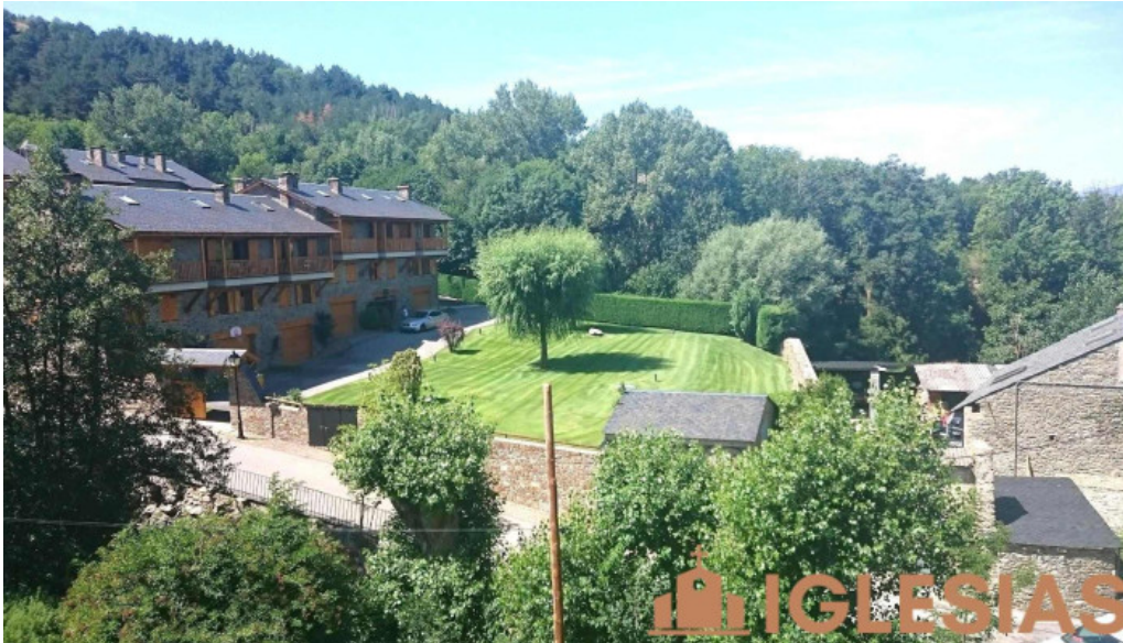
Fontanals de cerdana iglesias