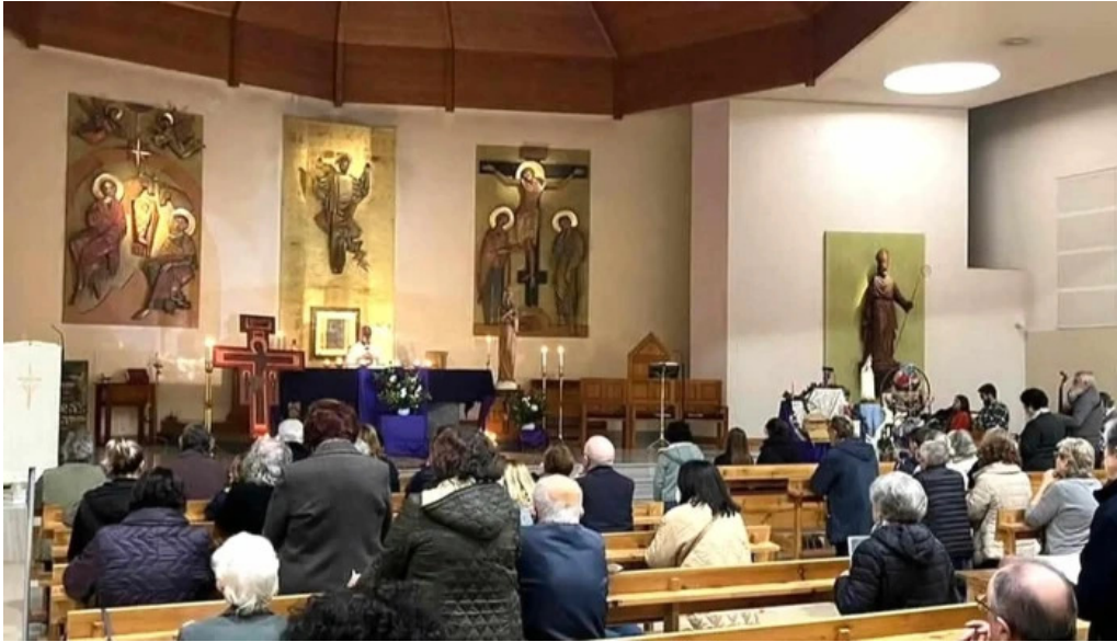
Parroquia san fulgencio videos