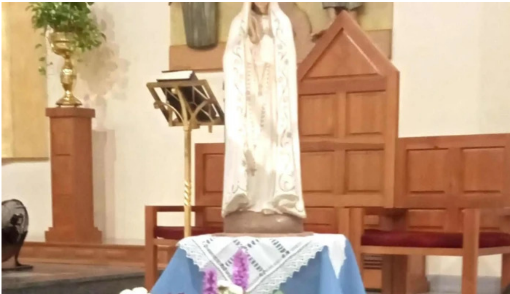
Parroquia san fulgencio comentarios