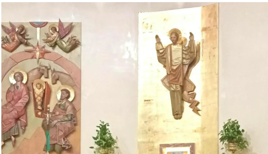
Parroquia san fulgencio cartagena