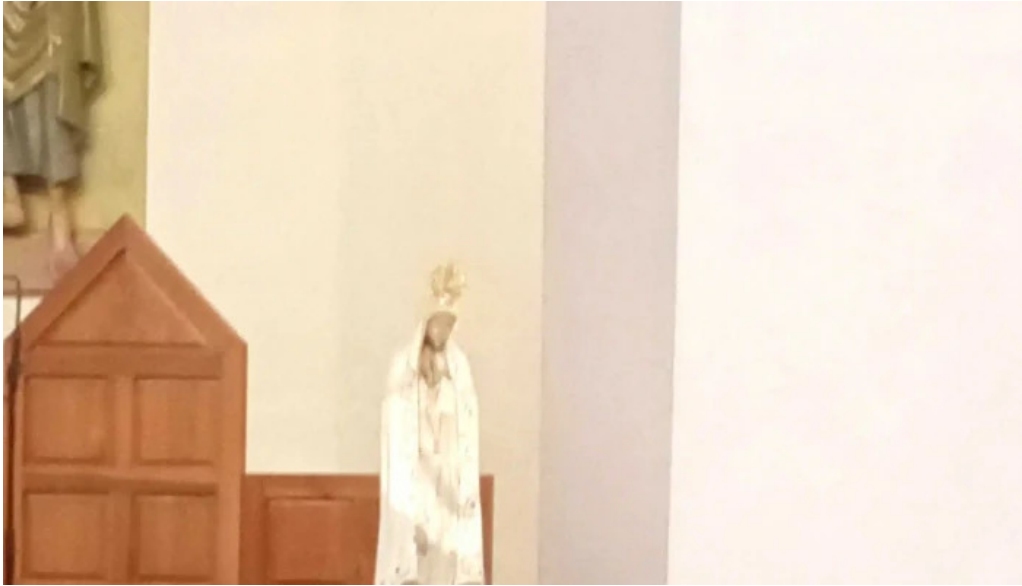
Parroquia san fulgencio horario