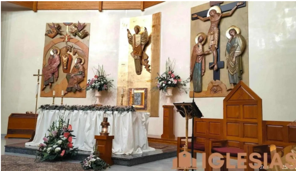
Parroquia san fulgencio parroquia