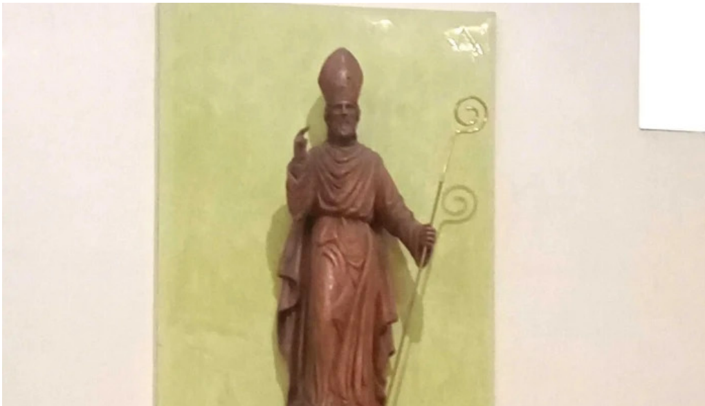
Parroquia san fulgencio ubicacion